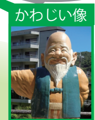
local mascot monument

butcher shop Sakabun 肉の坂文 open : 11:00~21:00 close : Thursday croquettes are famous ※Takeout only